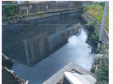
No. 1 付近