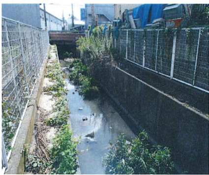
No. 9 付近