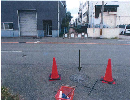
No. 9-2 付近