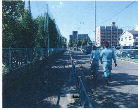
No. 17 付近