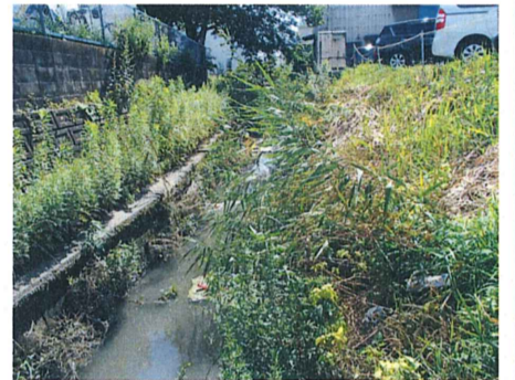
No. 10 付近