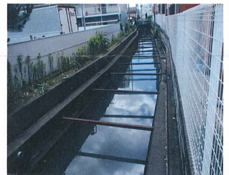
No. 2 付近