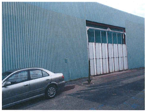
No. 13-1 付近