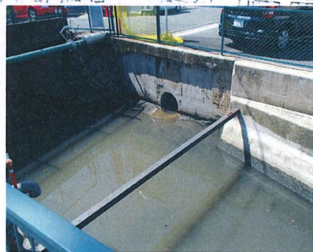
No. 3 付近