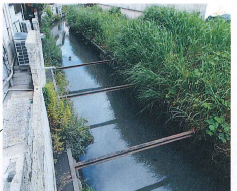
No. 1 付近