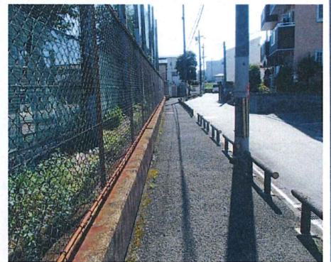
No. 15 付近