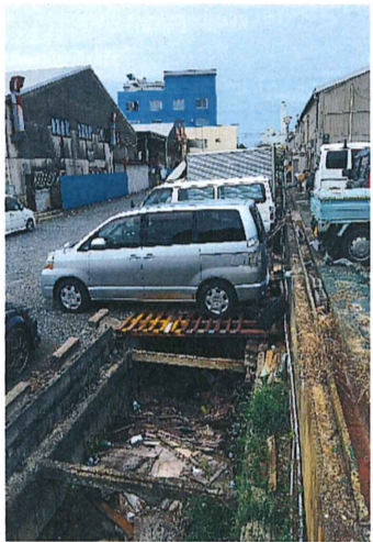
No. 9-3 付近