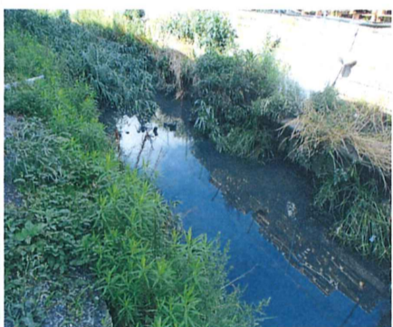
No. 7 付近