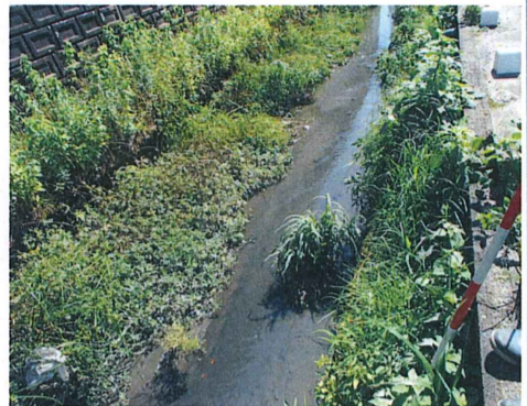
No. 11 付近