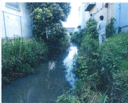
No. 6 付近