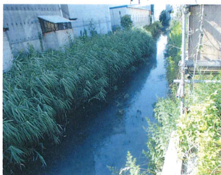
No. 5 付近