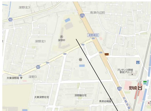
附近見取図 S: 1/4000